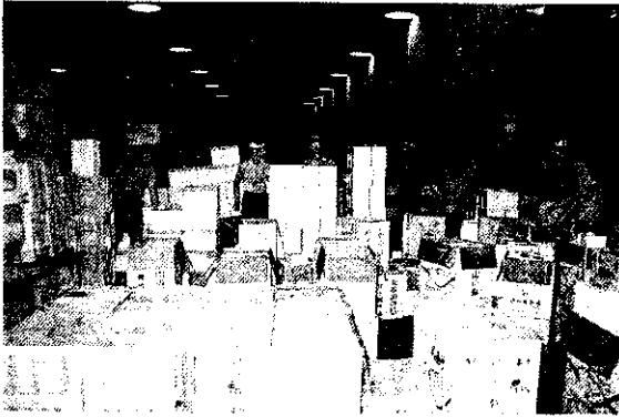
分級包裝魚貨立體堆放

(10)當地政府衛生局在市場設有衛生檢查所，派駐人員嚴格執行衛生檢驗，對檢驗有問題貨品的處理：