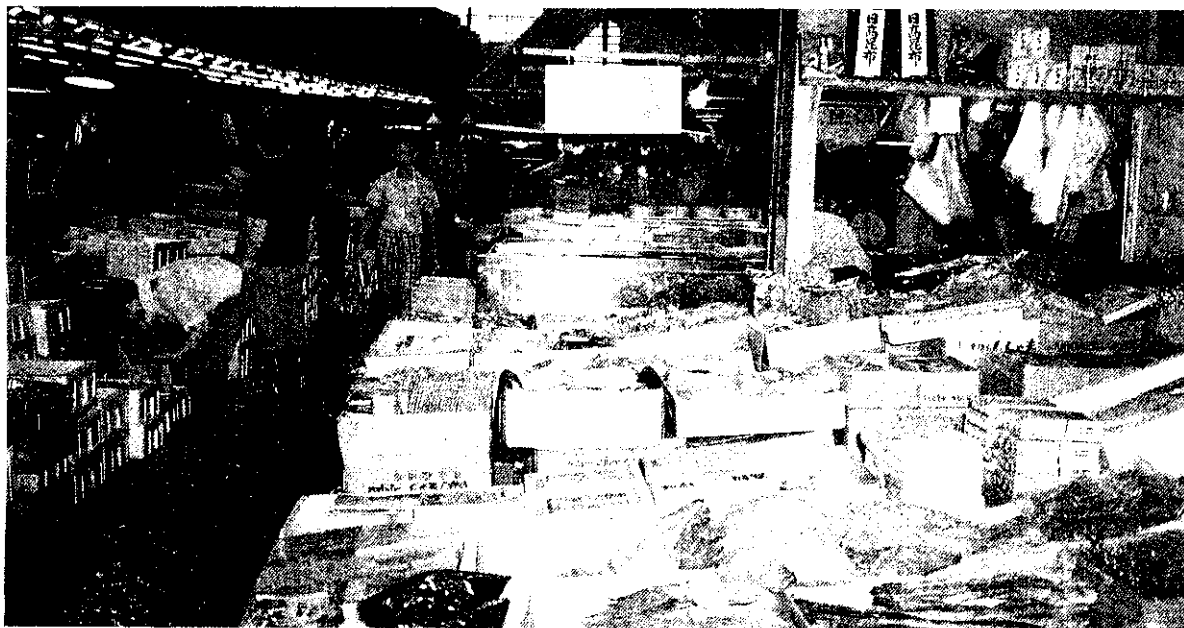
魚市場內承銷人攤位

我國近年來由於國民生活水準提高，消費結構逐漸改善，對於食品的消費，由量的需求轉為質的需求，更進而轉至健康及心理上的需求，因此在生鮮農產品之中，漁產品逐漸被視為理想的動物性蛋白質攝取來源。