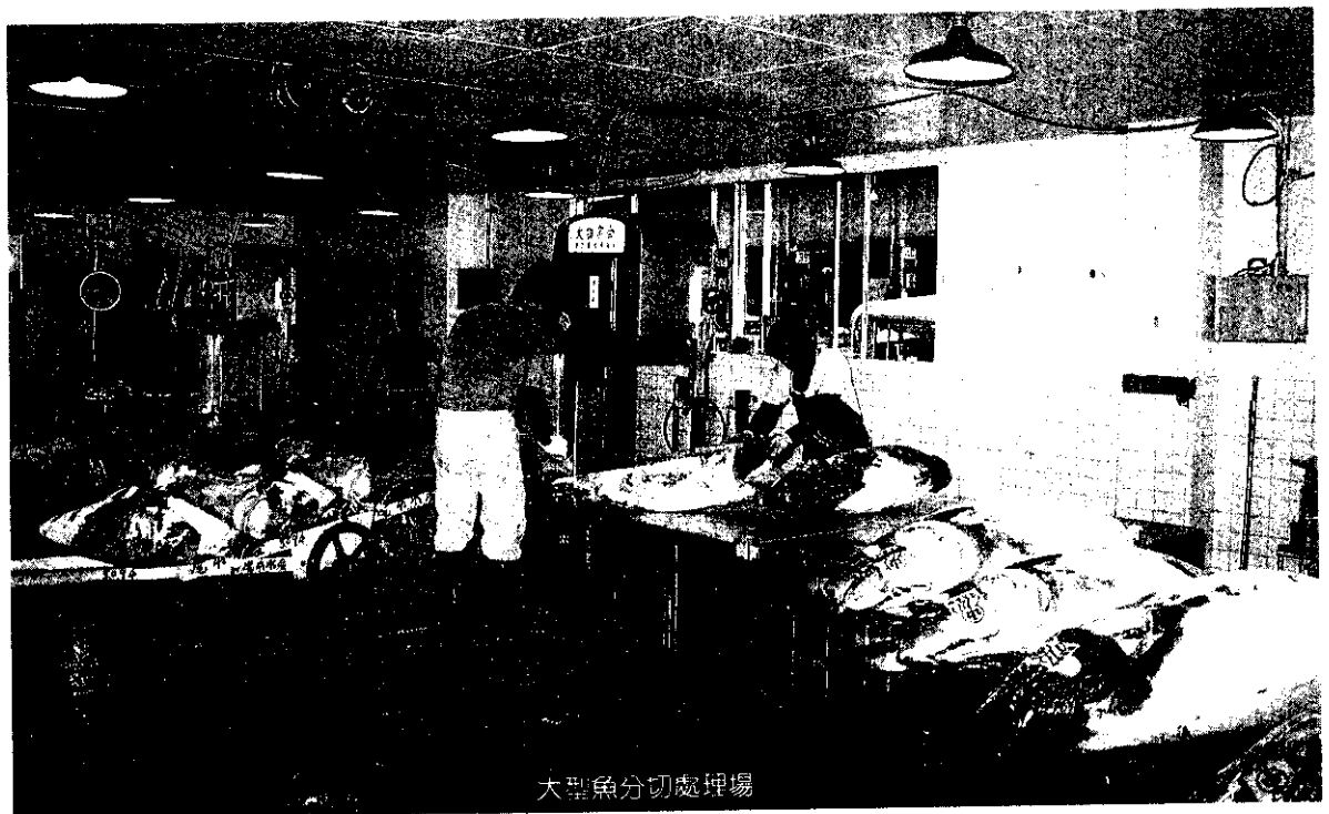
大型魚分切處理場