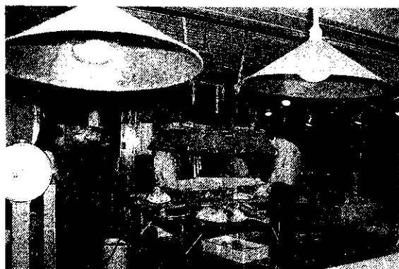
大型冷凍魚微波解凍

有攤位、店面，另有 600 個加工業承銷人（無攤位、店面）。反觀台北市魚市場却有 3,000 餘承銷人（包括代理人），而交易金額每日約 1,000 元~800 萬元，僅為築地市場水產部的 1/3，可見日本魚貨是大承銷制，而台灣僅屬小承銷制，以至資金及買賣規模有限，僅作原料型的買賣，尚然能力自行提高魚貨處理層次及拓展市場。