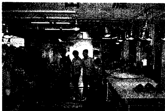
市場內承銷人之設備