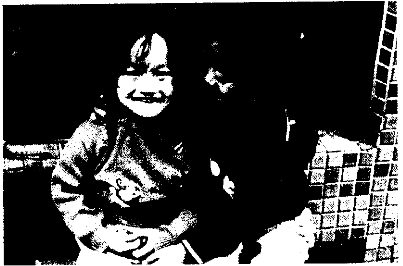
二姊妹感情好！（小鳳）