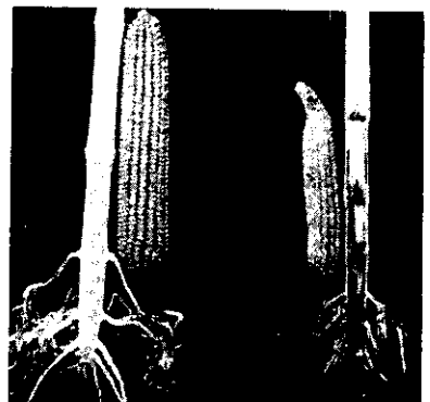
無用者根小 施用強根素根旺有力尾 無用者根小