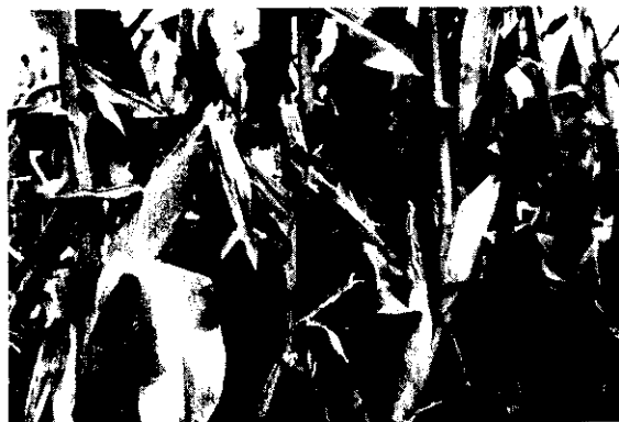
台東地區栽培台南選10號、台南11號及台農351號為主。

目前，台東地區栽培玉米的面積，約為6,000公頃。主要的栽培品種為台南11號、台南選10號、台農351號；台南11號及台農351號主要種於轉作田，以發揮其高產潛力，至於台南選10號則種於坡地及旱田。