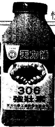
強壯素對豆類增收效果最大