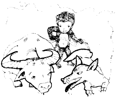
猴子將牛尾巴綁在狼身上