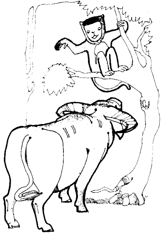
猴子向老牛打招呼：「老牛先生，您好。歡迎您這位新鄰居。」

久便趕到老牛吃草的地方。「猴兄弟，你真夠朋友。待我把牠吃了。」野狼大吼一聲，縱身欲噬。