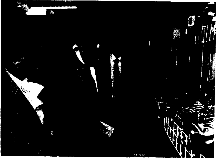
改進農產運銷，要建立商標制度。

(3)加強科技研究：計有「充實儀器設備擴大人才培育及延攬科技研究人才」，「高品質食米、加工用米、加工用甜玉米及外銷園藝新品種之選育」，「主要雜糧、蘆筍、洋蔥優良種子生產技術之研究」，「高品質種乳牛、種豬及家畜之選育與育種技術之研究」，「經濟魚蝦類種苗生產技術之研究」，「主要雜糧及施藥機械之研製」，「玉米螟綜合防治」，「重要家畜疾病疫苗開發及效力改進之研究」，「稻米品質分級及保藏技術之研究」，「主要雜糧產品乾燥及調理技術之研究」，「香菇及竹筍等產品加工之研究」，「高級香料提煉研究」，「製茶技術及其品質評定技術之研究」，「乳化類香腸製品之製造」，「廢棄及排泄物之處理與利用之研究」，「胚移植及疫苗遺傳工程之研究」等計畫16項，經費計1億零4百零1萬元。