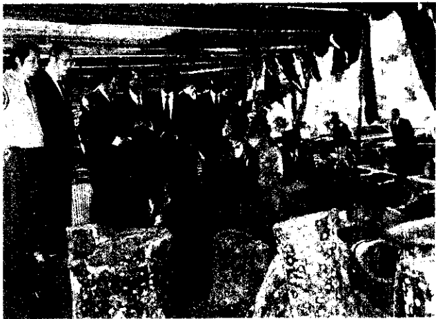
葡萄設施栽培及品質改進，是精緻農業發展項目之一。