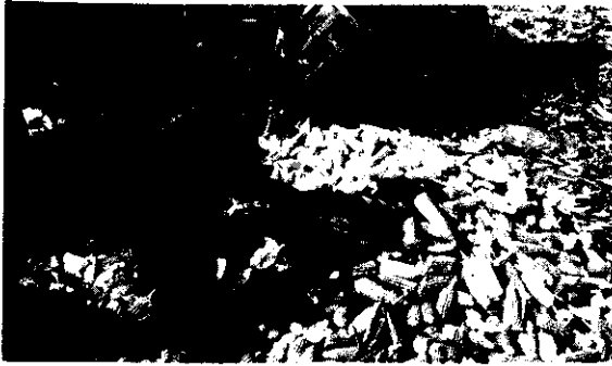
玉米採穗機可將苞葉去除50%

場型三輪式玉米採穗機」完成建立設計、製造、製配、品管的技術資料，移轉國內兩家大農機公司金合成、大地菱生產，供雜糧代耕中心玉米機械採收工作。