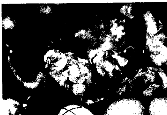
剛孵化出來的雞雛