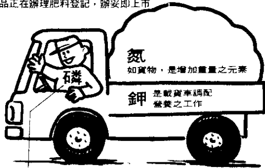
是司機、也是生命之源，是合成蛋白質之要素