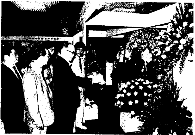
一項大規模的國際花卉展覽，4月19日在台北來大飯店舉行，由前副總統謝東閔剪綵揭幕，來自荷蘭、日本、新加坡、泰國、馬來西亞和我國的花商和生產者參加展出。（中央社）