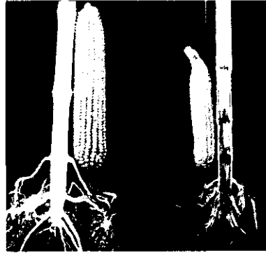
無用者根小無力尾