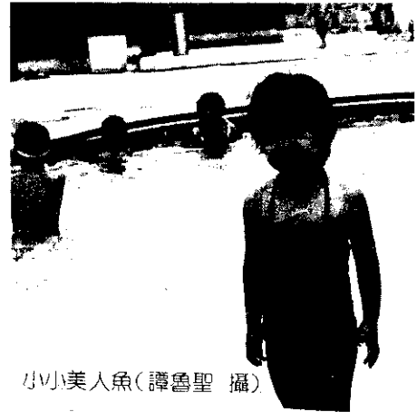
小小美人魚