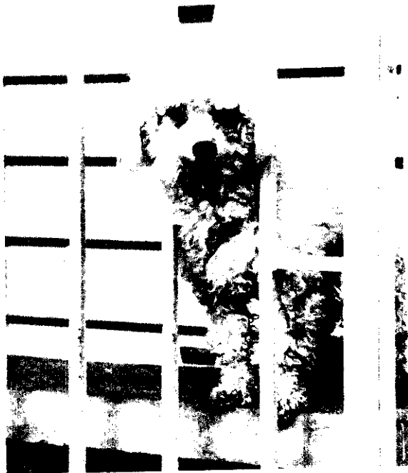
照顧良好的小狗