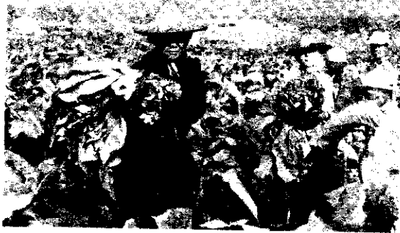
瓜園應遠離烟田