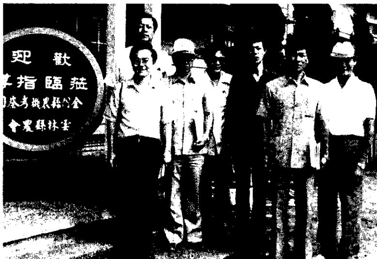
金門縣農業技術人員訪問雲林縣農會

會中決定展覽日期為10月25~30日，展覽地點為彰化市南興國小，展覽內容包括：農業推廣教育成果，彩色活動照片壁報，插花及水果彫切，農產品及農產加工品，手工藝品，農業器具，福蘭及玫瑰花