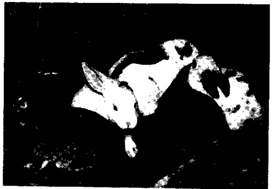
籠飼高架可以防寄生蟲

美日兩國近來兔肉大發利市。一方面是因為美日具有冷凍肉類設備的大小超級市場非常普遍，另方面