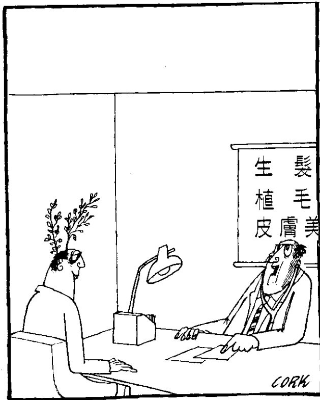
這是生髮劑的副作用