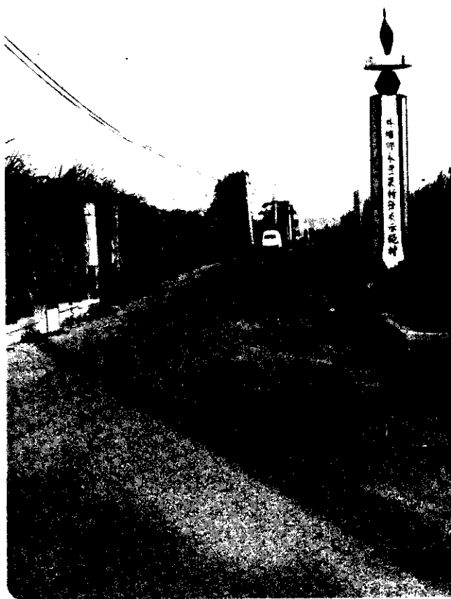
農路是農村交通之母，需要合理的規畫。

台南縣大內鄉環湖村是個僻遠的村落，農民非常保守，農業受地理的限制而無法實施機械耕作。最令我們困擾的是，沒有完整的農路，因農路狹窄，大型農機無法進入，有些田地的周圍都沒有通路，要到自己的田裡耕作，就必需走他人的田埂。肥料都要靠人力來搬運，這種作業方式實在太落伍了。而本村也沒有什麼水利設施，田地高低不平，我們希望本地實施土地重畫，闢建農路及溝渠，使每一塊田地都有通路，以促進農業機械化。相信其他鄉鎮也有這種情形，希望有關單位能予重視並輔導。