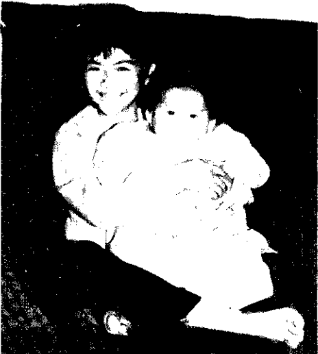
2個孩子搶搶好(丁二郎)

目前醫學儀器越來越發達，裝置樂普的婦女，可以用超音波來檢查是否有掉落的現象，而附有尾巴的樂普，不但取出方便，更易於檢查是否留在子宮內。