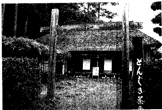
舊式日本農宅(林妙娟)

點眼藥水，務請遵照醫師指示使用，當念「瓶中藥，滴滴皆辛苦」，每次1滴，不可食多，「點到為止」即可。(心梅)