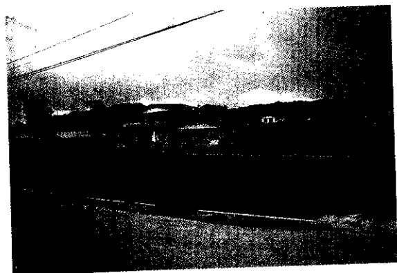
現代日本農宅(林妙娟)