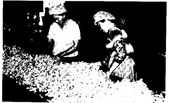
輔導設立特產加工廠，對繁榮農村經濟的幫助很大。(廖敏卿)