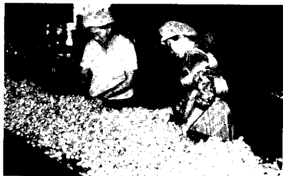
輔導設立特產加工廠，對繁榮農村經濟的幫助很大。（廖敏卿）