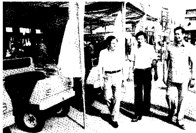
黃縣長視察農業展覽會場

另外又舉行：彩色活動照片壁報展示競賽，冠軍——田中鎮，亞軍——芳苑鄉、秀水鄉，季軍——福興鄉、社頭鄉、花壇鄉，殿軍——二水鄉、二林鎮、北斗鎮、埔心鄉；精神總錦標競賽：冠軍——秀水鄉，亞軍——田中鎮、永靖鄉，殿軍——花壇鄉、福興鄉、芳苑鄉，優良獎——二水鄉、大村鄉、田尾鄉、二林鎮、溪州鄉、溪湖鎮、芬園鄉、員林鎮。