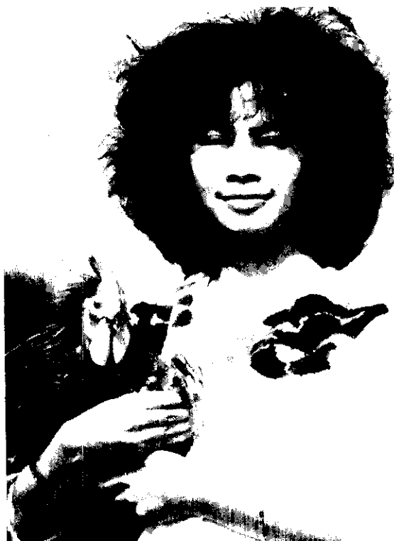
土雞專業化大量生產， 仿土雞不再吃香了！

雞病首重飼養環境衛生改善及預防，因此雞場應建造於高台地通風及排水良好，4周無民家及障礙物之處，並保持飼養環境清潔，訂定完整防疫計畫，切實執行，不得懶惰。