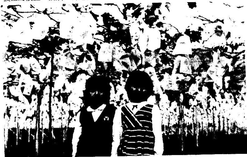
在觀光葡萄園內享受全家溫馨的氣氛

在經過初步處理後，仍應儘速送醫，最好將空瓶、空盒及小孩的嘔吐物、瀉物一起送醫，並查明小孩的服用量及服食時間，使醫師做緊急適當的處理。