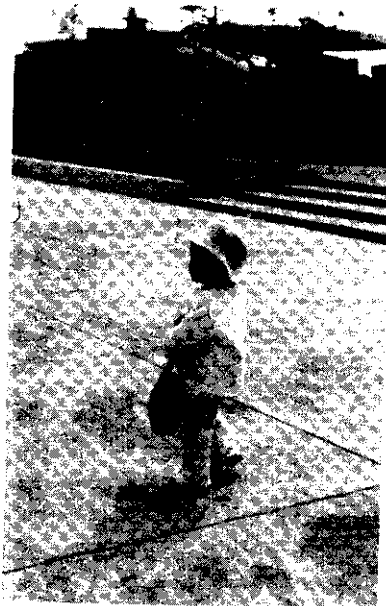
媽媽怎麼不見了？