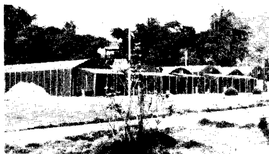
(台灣省農業試驗所菇類研究室)