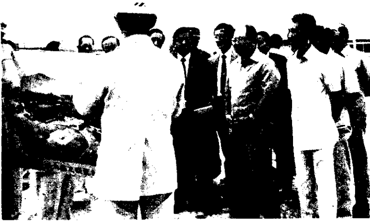
台灣省政府主席邱創煥巡視花蓮縣地方建設(中央社)