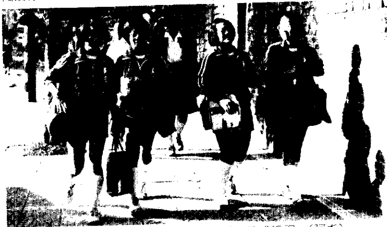
持續閱讀過久，易使眼睛疲勞，造成近視。(阿手)