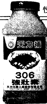
強壯素對豆類增收效果最大