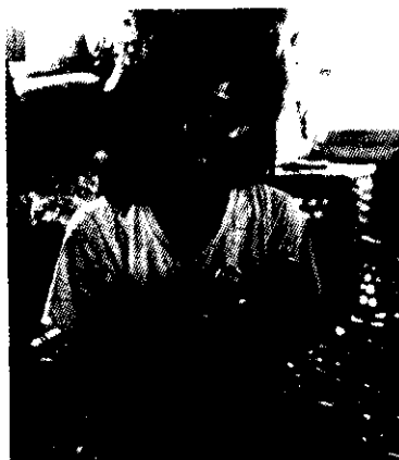
封面：林邊鄉黑珍珠蓮霧