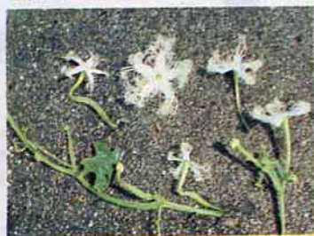
蛇瓜的雌花(左)和雄花(右)