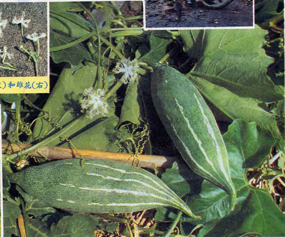
蛇瓜短果品種，長不過20公分