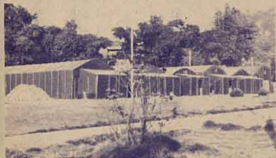
(台灣省農業試驗所菇類研究室)