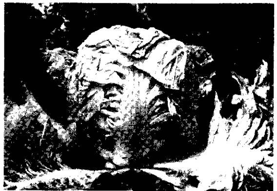
多吃蔬菜，有益健康。

凡是深綠色蔬菜及豆類均含有維生素 B 2 ，其功用是幫助氨基酸、脂肪酸與醣類的代謝。缺乏時最常見者為口角炎、角膜炎等症。