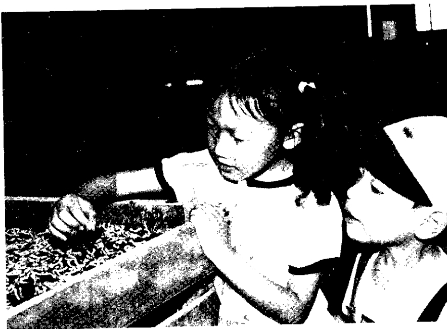
好可愛的寶寶齊！

經常聽到許多人談到，2個孩子有伴比較理想，對嗎？由於孩子幼年時期與父母親生活在一起，等