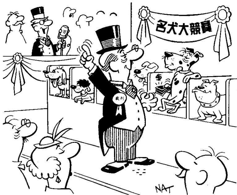
大家請注意，裁判先生即將選出本屆冠軍狗。