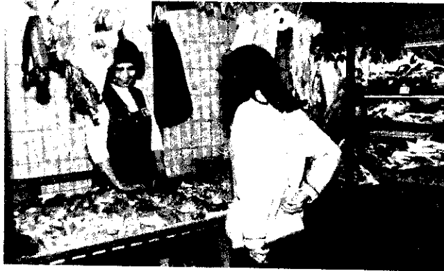
肉攤上沒有冷藏設備，細菌容易滋生，衛生堪慮。