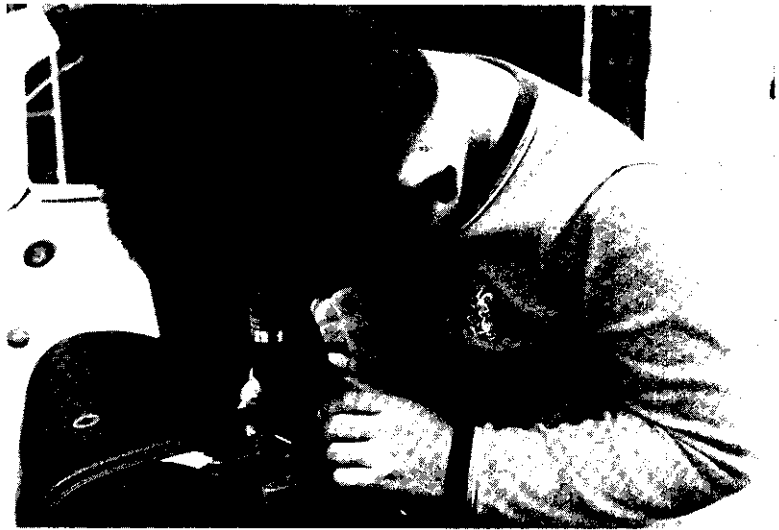
教導孩子培養求知精神

由於結紮手術是一種不能輕易回復輸卵管再通的手術，也就是說，結紮以後要想再生育時，必須將輸卵管接通。這種接通手術的成功率只有50%的機會。因此，必須是本人及配偶欣然同意。換句話說，是夫婦兩人對結紮手術的認同是絕對肯定的，醫師才會施行結紮手術。