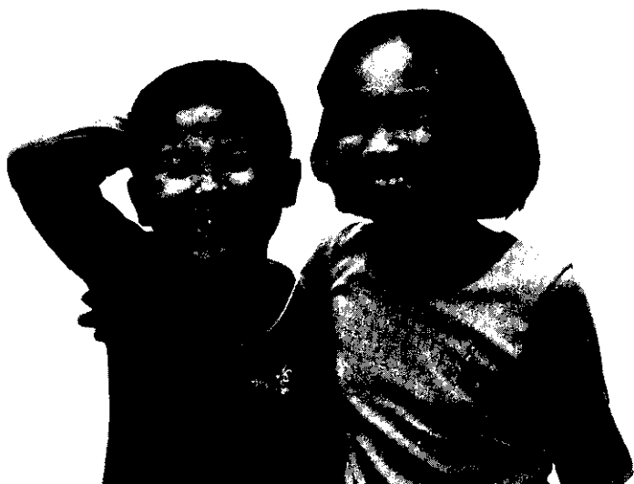
哥倆好，實一對。(小洪)

輸卵管結紮最適當的時機，是在月經乾淨後未性交之前，或確定沒有懷孕之時，或者是在生產、流產之後順便結紮。一般而言，任何年齡的婦女，只要有足够的子女數，不想再要孩子，而且個性成熟，情緒穩定，不亂聽信謠言，都可以