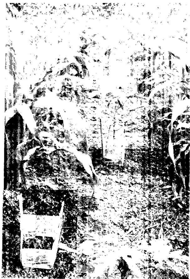
利用塑膠套保護木瓜幼苗，同時間作玉米，對輪點病有防治之效。（曾保雄 攝）

3. 木瓜園的位置與發病關係：木瓜園的位置與發病有密切的關係，果園距離病株愈遠，或逆風方向處有高大障礙物，則因蚜虫傳播較困難，發病率降低，否則發病率較高。