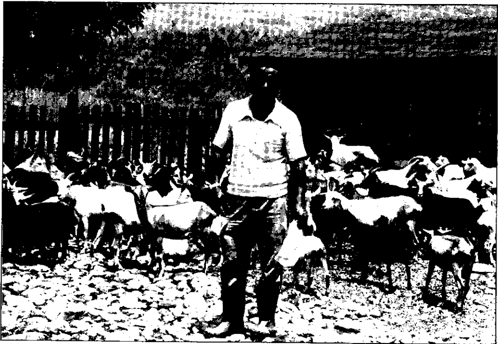
家有喜事，做主人的多開心！

山羊的懷孕診斷方法隨科技進步而有改進，如X光檢驗、血液或乳液中助孕素的測定，但一般飼養者仍以觀察配種後21天，有無再發情為判斷懷孕與否的最簡單方法，