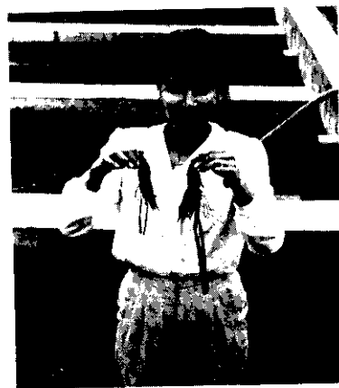
封面：好大的泰國蝦！