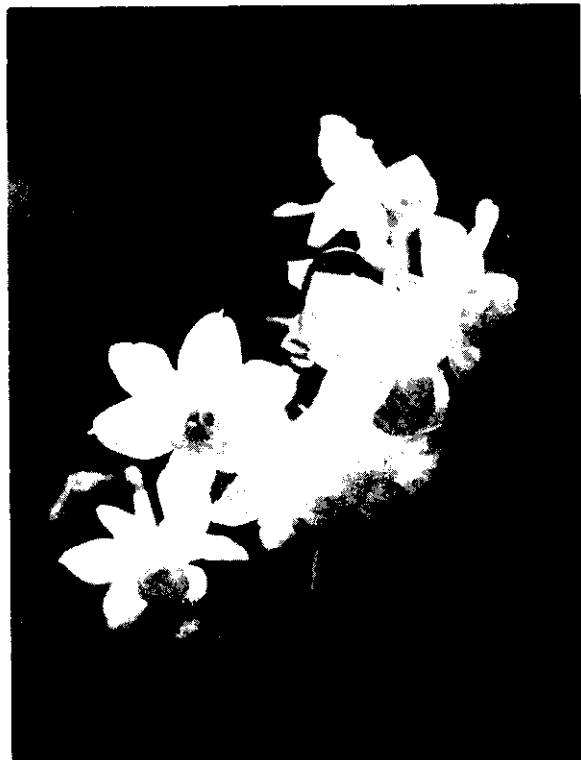
圖3 中國水仙

當種球主芽已伸出鱗莖時，才可進行閹割處理。閹割時，刀口在鱗莖主芽葉之扁平面的兩側，由最外層鱗片的基部斜上刺入，刺入的角度與鱗莖底面約成 20^{\circ}\sim 30^{\circ} 角。閹割的深度，相等於由莖頂所引垂直線與鱗莖底面的相交點，向主芽葉之扁平面的兩側，到鱗莖底面外緣的距離，傷口的寬度約為1~2.5公分，依種球大小而定，球的直徑越大，傷口越大，才能將鱗莖單位完全切離原來母球的基盤。