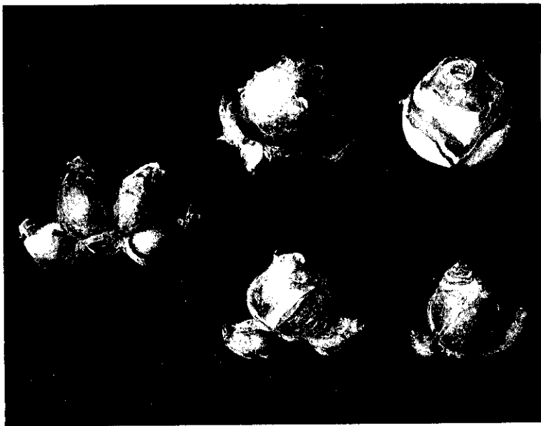
圖2 閹割手術施行後比較

品質。水仙種球在未栽植以前，鱗莖內部的腋芽早已發育成具有鱗莖的雛形，我們稱之為小鱗莖單位，這些鱗莖單位在種球栽植後隨着整個種球的發育，在採收時即已形成所謂的側球。如果我們在種球未栽種以前，先將這些鱗莖單位小心地切除，而不影響原來種球主芽的正常生長，那麼由於植株所有的養分，只需供應主芽的發育，因此種球採收時，只能收到一個碩大的種球。