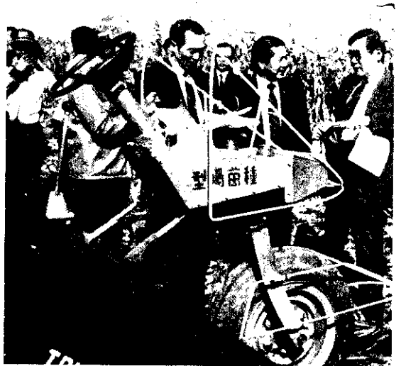
農委會王主任委員到玉米產區巡視 玉米採穗機作業情形

⑩ 其他國產新型農機,以補助50%估算,預定補助290台,補助經費25,868,000元。