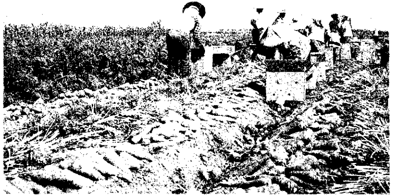
參加共同運銷的產品，必須是農友自行生產的。

生產資料卡須載明作物栽培面積、預估產量，或牲畜飼養頭數。供貨資料卡須載明各月份預期供貨量以及實際供貨量。