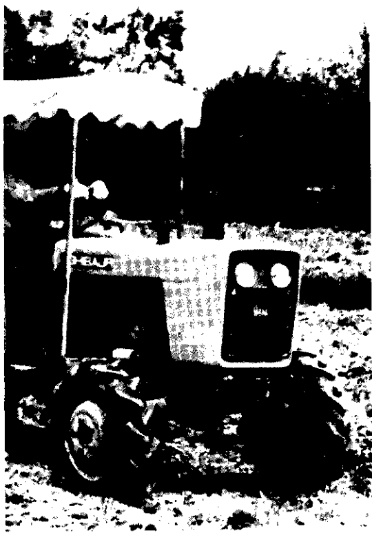
機械整地作畦

3. 利用作畦機播栽培可增加單位面積產量及收益：根據調查，春作機播示範區，每公頃英果產量2,479公噸，人工播種區2,368公斤，增產111公斤（增收4.69%），每公頃增加收益 3,885元，以春作機播面積增加產增量收益為 5,750,966元，秋作示範區產量2,402公斤，人工播種區 2,222公斤，增產180公斤（增收8.1%），秋作機播面積計增產量收益為14,119,560元，全年總增加收益達 19,870,526元。