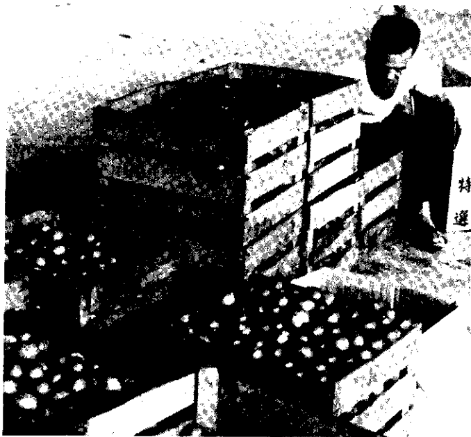
特選 分級包裝