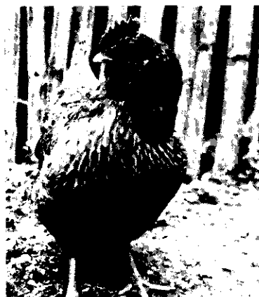
封面：仿土雞