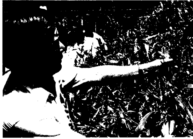
薏仁是好的中藥材