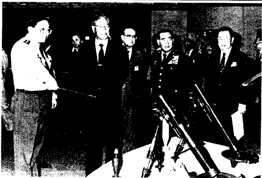
副總統李登輝參觀紀念先總統蔣公百年誕辰「國防科技與兵工生產」展覽

台灣省政府決定動用141億8千萬元，在本年度計畫收購稻谷55萬2千公噸、辦理田賦徵實及隨賦徵購稻谷14萬7千2百公噸，並輔導農會收購農民餘糧23萬公噸。