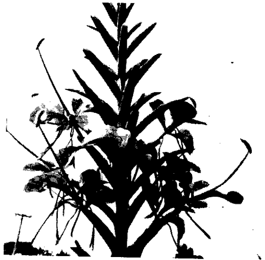
薑花新品種 J-1 26

●青割玉米是營養價值很高的飼料作物，通常在青割後製成青貯，用以飼養乳牛。因為利用的時期和部位都不同於一般子實用玉米，所用品種和栽培管理也特別。34頁向你介紹這方面的新知識。