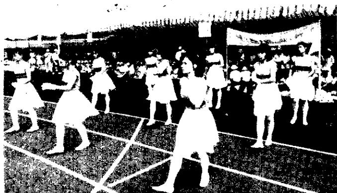
草屯四健會啦啦隊在「台灣區農民運動會」中表演（洪永村）

嘉義分場原位於嘉義市民生南路208號，成立於民前5年，隸屬於日據時期台南州農事試驗場。台灣光復後，由台南區農業改良場接管。因為租用土地迭遭破壞，乃計畫遷建。承鹿草鄉公所鼎力協助，覺得座落鹿草鄉豐調村土地，報奉上級核准，於72年2月購地展開遷建事務，75年10月22日落成。